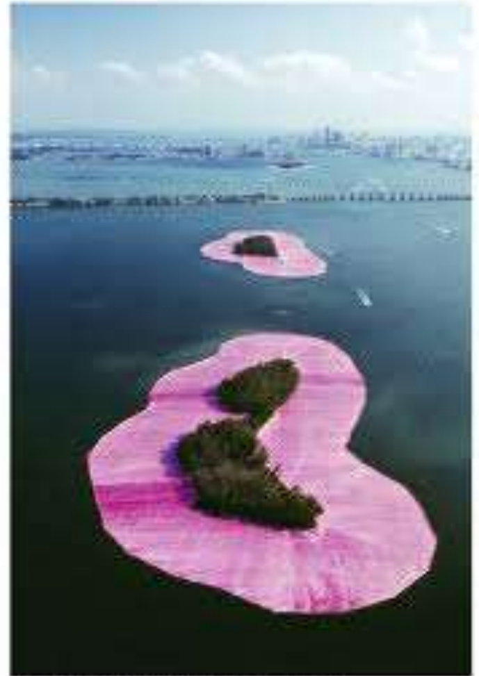
© 2004, the artist (owner), Environmental Media, Boston MA, www.smithson.com, 02111 Photo: William Bar, Columbia, Ohio, 06111